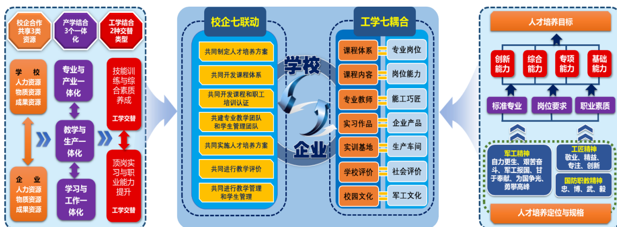
图1 “校企七联动、工学七耦合”人才培养模式

军工特质： 在专业学习中，通过典型军工产品作为教学载体来开展教学活动，融入精益求精、质量第一、安全保密等意识；通过国防教育和军事训练，磨炼学生吃苦耐劳的精神、坚忍不拔的毅力和团结友爱的集体主义精神；通过国防大讲堂和红色文化教育教育基地实践，培养学生良好的习惯、顽强的意志；通过军企实习和社会实践，增强学生服务国防、奉献军工的使命感与责任感。将“忠、博、武、毅”的国防职教精神和军工精神贯穿育人全过程。